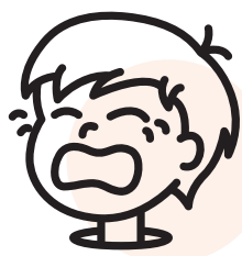
Quand je suis fâché