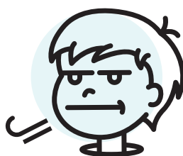
Je me calme en respirant